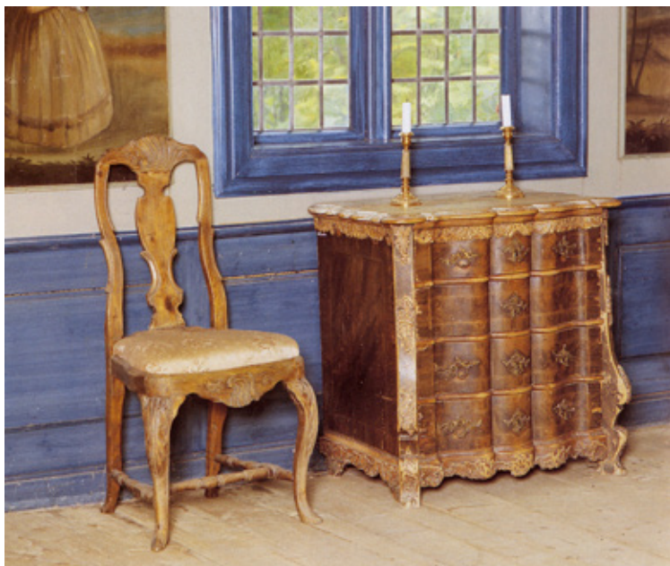
Rokoko-kommode og stol, Myttingstua, Foto: Leif Stavadahl, Maihaugen