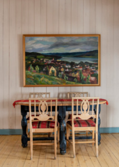
Einar Austli: Spisestue.