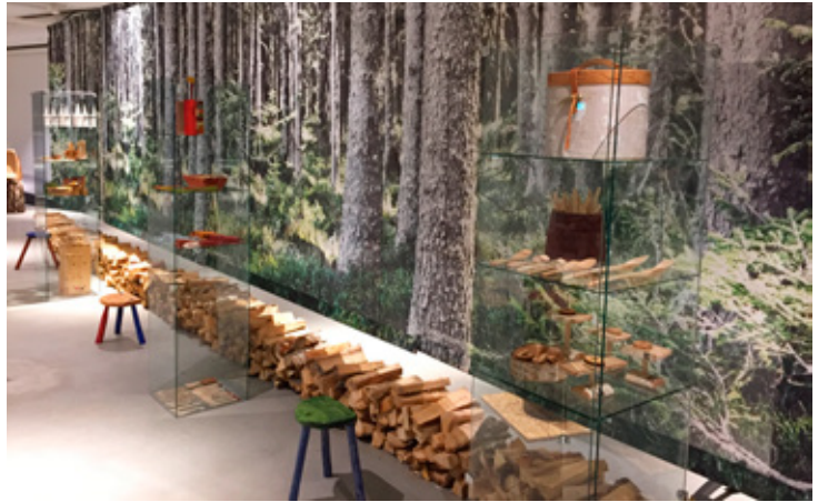
Utstillingene «Ur bjørk» og «Tre inn i framtiden» var de første utstillingene som ble lagt til Sandvigsalen.

Det var en stor investering å sette lokalene i attraktiv og full teknisk stand. Flere gene-