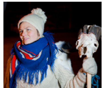
En ekte julebukk leder an i vandringen.

Under julemarkedet er det også i år sjanse til å bli med på «Det lyser i stille grender – en vandring i tussemørket». Her får publikum bli med på en stemningsfull førjulstur gjennom museet. En julebukk tar oss med på en reise i tid fra prestegården på slutten av 1700-tallet og frem til jula slik som vi kjenner den i dag, med juleforberedelser og smaker fra ulike tider. Den 75 minutter lange vandringen passer for barn fra ti år og oppover til hundre, så lenge man ikke er redd for tussemørket. Vandringen ble arrangert første gang i 2013, og har vært svært populær.