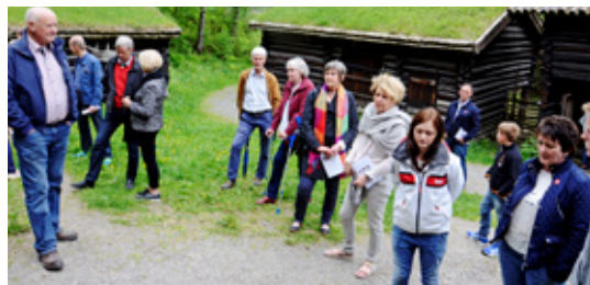
Dølene på Knutslykkja.